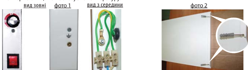
схема підключення нагрівача електричного побутового модель НЭБ-М-НС

Увага! Положення вказані на термостаті, являються лише візуальною розміткою, для зручності використання, яка не вказує на температуру.